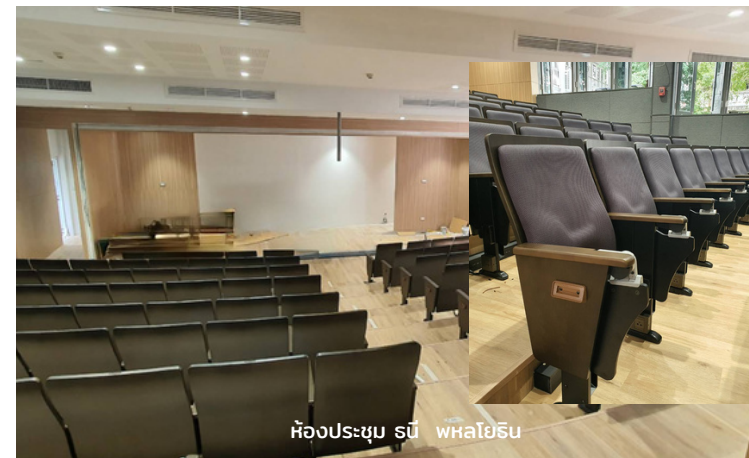
ห้องประชุม รณี พหลโยธิน

เมื่อวันศุกร์ที่ 23 กันยายน พ.ศ. 2565 ทีมผู้บริหารคณะสังคมศาสตร์ ได้เข้าตรวจความคืบหน้าการก่อสร้างโครงการฯ โดยในสถานการณ์ปรับปรุงสำนักงานคณะสังคมศาสตร์และภูมิทัศน์ ได้ดำเนินการไปแล้วกว่าร้อยละ 80 รวมถึงในส่วนห้องประชุมรณีฯ ซึ่งได้มีการติดตั้งเก้าอี้ และอยู่ระหว่างการเตรียมติดตั้งครุภัณฑ์ด้านโสตทัศนูปกรณ์