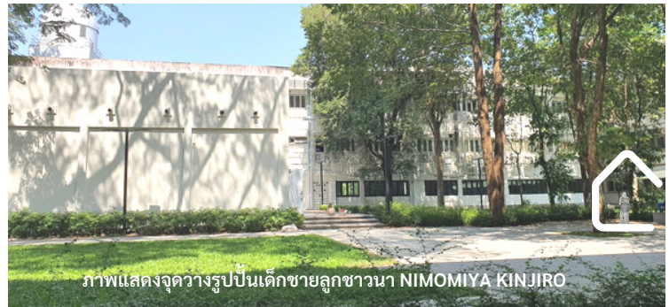
ภาพแสดงจุดวางรูปปั้นเด็กชายลูกชวานา NIMOMIYA KINJIRO

คณะสังคมศาสตร์ ได้ดำเนินการก่อสร้าง “โครงการปรับปรุงห้องประชุม รณี พหลโยธิน ภูมิทัศน์และสภาพแวดล้อมโดยรอบห้องประชุม และ สำนักงานคณะสังคมศาสตร์” โดยเริ่มดำเนินการเมื่อ 13 ธันวาคม พ.ศ. 2564 ปัจจุบัน กระบวนการก่อสร้างปรับปรุงได้มีความคืบหน้าไปตามลำดับ