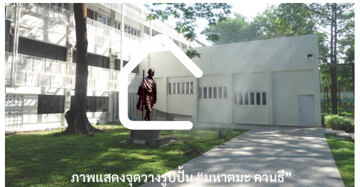
ภาพแสดงจุดวางรูปปั้น “มหาตมะ คานธี”

นอกจากนี้ คณะสังคมศาสตร์จะนำรูปปั้นเด็กชายลูกชวานา NIMOMIYA KINJIRO สัญลักษณ์ความขยันของคนญี่ปุ่น ซึ่งได้รับบริจาคจากครอบครัว TOMAMATSU และ TERUSHI TOMITA เมื่อปี พ.ศ. 2549 และรูปปั้น “มหาตมะ คานธี” ซึ่งได้รับมอบจากสถานทูตอินเดียประจำประเทศไทย เพื่อเป็นที่ระลึกในการจัดตั้งศูนย์อินเดียศึกษา มหาวิทยาลัยเชียงใหม่เมื่อปี พ.ศ. 2562 มาจัดวางในพื้นที่ลานจามจรีด้านหลังห้องประชุมที่ได้ทำการปรับปรุงภูมิทัศน์ดังกล่าว