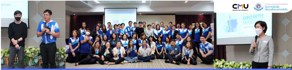
โครงการเสริมสร้างทัศนคติเพื่อการทำงานยุคใหม่ (Workforce Growth Mindset) วันที่ 14 มีนาคม 2566 ณ ห้องประชุมฝ้ายคำ สำนักบริหารวิชาการ มหาวิทยาลัยเชียงใหม่