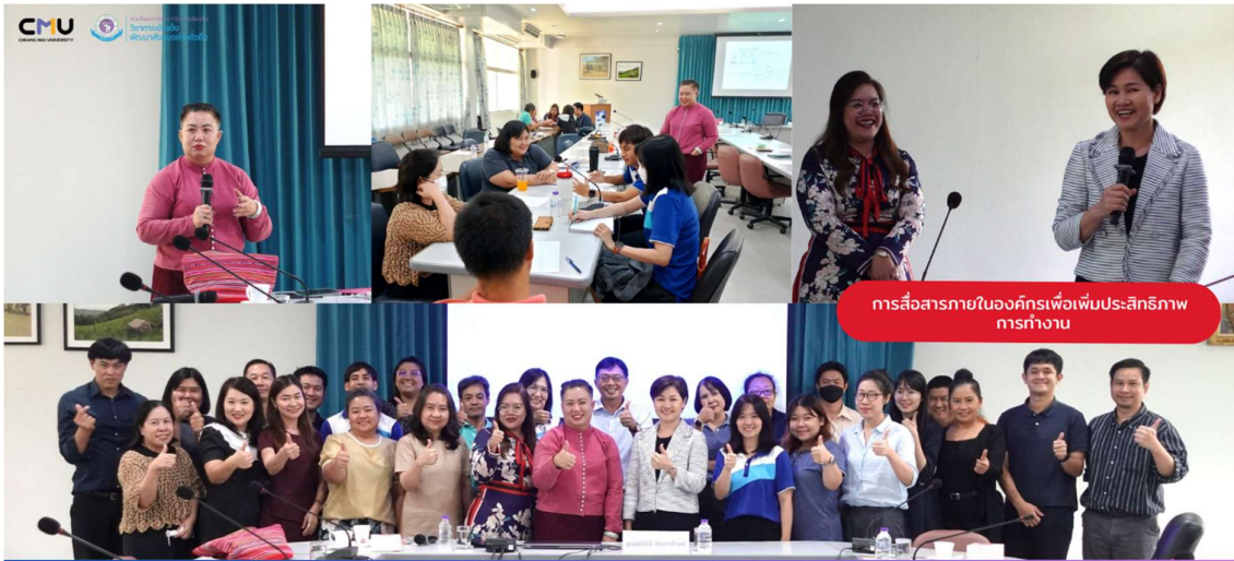
การบรรยายพิเศษ เรื่อง "การสื่อสารภายในองค์กรเพื่อเพิ่มประสิทธิภาพ การทำงาน" 📅 21 กันยายน 2566 ณ ห้องประชุมอาคารปฏิบัติการณ์ 4 คณะสังคมศาสตร์ มช.