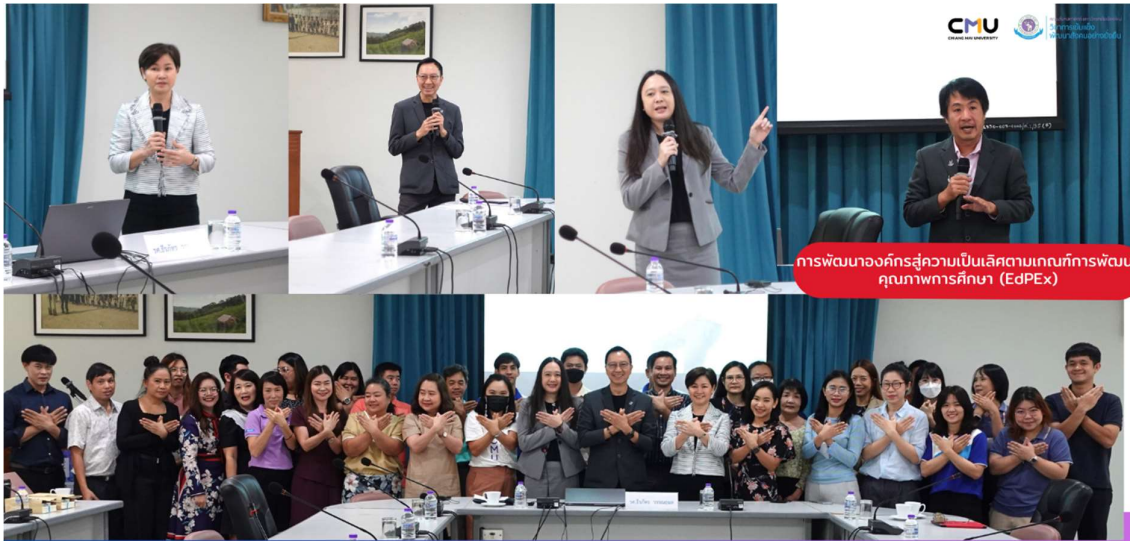
การบรรยายพิเศษ เรื่อง "การพัฒนาองค์กรสู่ความเป็นเลิศตามเกณฑ์การพัฒนา คุณภาพการศึกษา (EdPEX)" 📅 21 กันยายน 2566 ณ ห้องประชุมอาคารปฏิบัติการณ์ 4 คณะสังคมศาสตร์ มช.