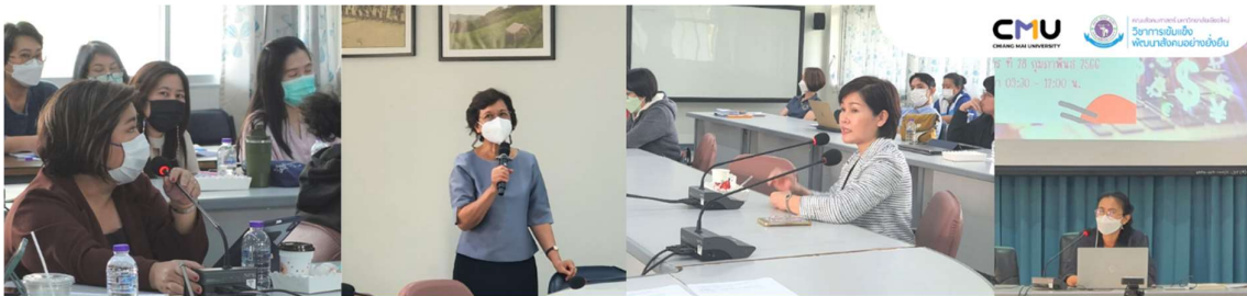
กิจกรรม : แลกเปลี่ยนเรียนรู้ (KM) “จิตตาแพนเธอร์ไอเดีย #EP1 งานก้านเงิน” วันที่ 28 กุมภาพันธ์ 2566 ณ อาคารปฏิบัติการณ์คณะสังคมศาสตร์