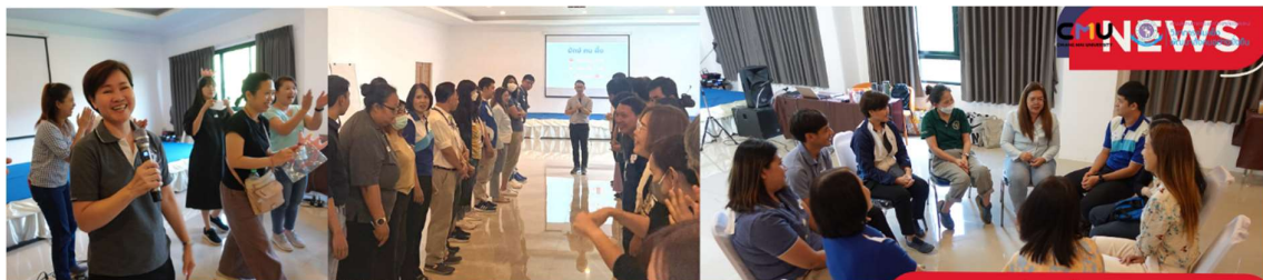
การพัฒนาองค์กรสู่ความเป็นเลิศตามเกณฑ์การพัฒนาระบบงาน (EdPEX)