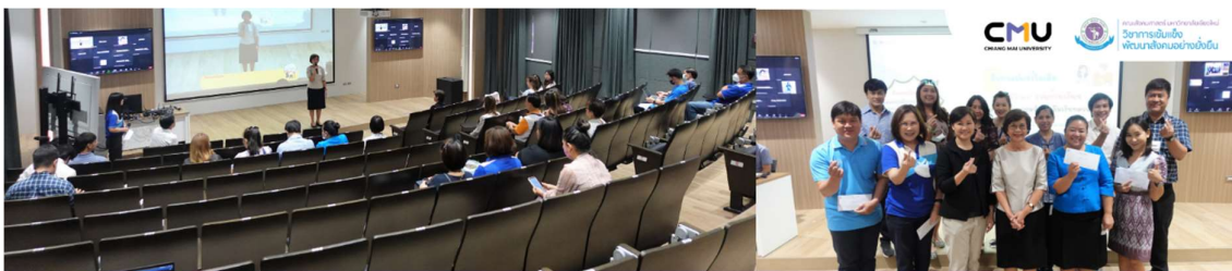
กิจกรรมแลกเปลี่ยนเรียนรู้ (KM) "จับกาแพชเรโอเดีย" #EP2 งานก้นเงิน"การใช้โปรแกรมสัญญาขีมีเงินทดรองจ่าย" 19 พฤษภาคม 2566 ณ ห้องประชุมนี้ พลาลัยณ คณะสังคมศาสตร์ มหาวิทยาลัยเชียงใหม่